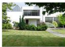
Fundação Júlio Resende