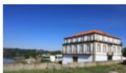
Casa Branca de Gramido

Integra um território que acolhe um património cultural de relevo, do qual se salienta a Casa Branca de Gramido, onde se realizou a convenção com o mesmo nome, a Igreja matriz, exemplar de templo setecentista, e a Fundação Júlio Resende, também designada «Lugar do Desenho», criada a partir do espólio de mais de 2000 desenhos que Mestre Júlio Resende reuniu ao longo da sua carreira. As praias de Ribeira de Abade e Lavandeira, situadas na marginal do Rio Douro, foram imortalizadas na literatura portuguesa por Júlio Dinis.