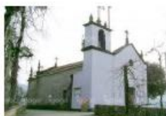
Igreja de Valbom