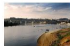
Ribeira de Abade

O tecido social valboense caracteriza-se por um forte dinamismo associativo, facto que o AEV tem procurado valorizar, estabelecendo e reforçando parcerias e protocolos com entidades locais, cujo contributo no cumprimento da sua missão educativa e na dinamização de algumas ações estratégicas nas áreas da educação inclusiva e formação de adultos tem sido assinalável.